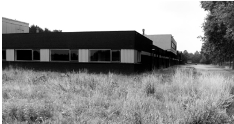
• Rublo, het begin van het streekstrookconcept

Buttonville: “In de eerste plaats, alles wordt honderd procent duurzaam en energieneutraal. We beginnen bij de Rublo. Die gaat weg. Op die plek komen de spoedeisende hulp en spoedoperatiezalen. De specialismen met bijbehorendheden komen aan het andere eind van het streekstrookconcept, eindigend bij de voormalige hallen van de Deco die al provisorisch in gebruik zijn. Tussen beide delen projecteren wij een innovatieve lintbebouwde gezondheidscampus met ondermeer de verpleegafdelingen, die als paddenstoelen in een heksenkring in de bestaande dorpsstructuren oppoppen. Langs de rand van het dorp, langs Tuitstraat en Bettekamp, langs de Varsseveldse Es en de eskopjes. Alles verbonden door een organocir-