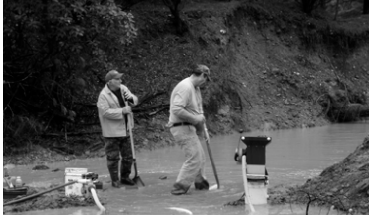
• De zogenaamde testdig in de Vennebulten verdiept zich snel.

Een huizenhandelaar met een leefkuilkantoor, aan een wijntje nippend in het etablissement, kan zijn geluk niet op. “De huuzeprieze schiet now al umhoge en ‘t zol zomaor ‘t ende van de krimp kōnnen beteikenen, in elk geval an de krimp in miene knippe, hahaha”.