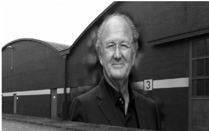
• impressie ziekenhuisgevel foto: Operatie SZ

Hij oogt tevreden en begint het informele gesprek zonder verdere plichtplegingen. "Wat ik u nu ga vertellen mag zo in de krant ... Wat een verblindend streekzorgplan heeft die Buttonville uit zijn mouw geschud. Varsseveld als zorgcentrum voor de Achterhoek! We zijn bij de gemeente dan ook meteen de 'Operatie SZ' gestart. Samen met een welbekende entrepreneur uit de Nederlandse amusementsindustrie - ik mag het zeggen 'Joop' - is een uniek financieel concept bedacht. Het begrip opname in het ziekenhuis zal voor de patiënt een totaal andere betekenis krijgen! Als deze toestemming geeft voor opname wordt de patiënt medespeler, c.q. deelnemer in een doorlopende live stream soap serie. Utopia is er niets bij. De ziekenhuisopname, met eventuele operatie en verdere zorgverlening, is dan geheel gratis. Oui gratuit! Free, umsonst!"