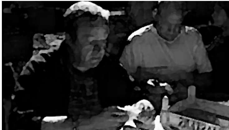
• Twee eenpitters in Etten-Leur delen een slecht verlicht kippenhok