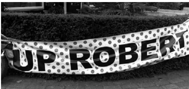
• het filmposterspandoek voor de film lekte uit