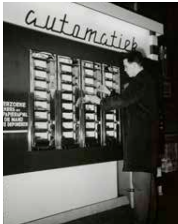
• Nouveau Nostalgie?

Gaan de Flamkuchen van Lekkernej plaats maken voor Brioche de Feu? Wordt de Schoolstraat de nieuwe PC Hoofdstraat van de Achterhoek? Brasserie 08 heeft voor de zekerheid al contacten gelegd met sterren kok Herman den Blijker. Maar hoe zit het dan met de geruchten over de heropening van de automatiek?